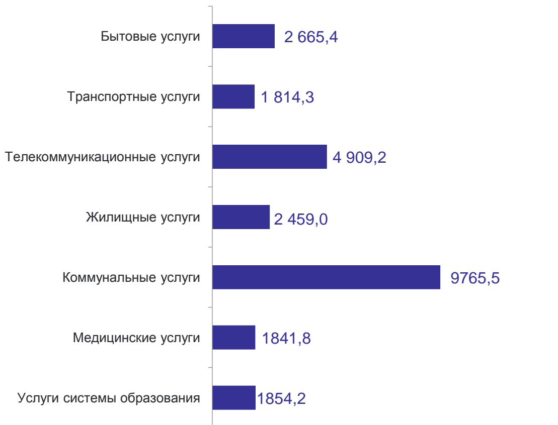
Объем услуг, млн рублей